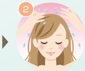
よくなじませ流します