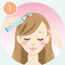
ローションを塗布します